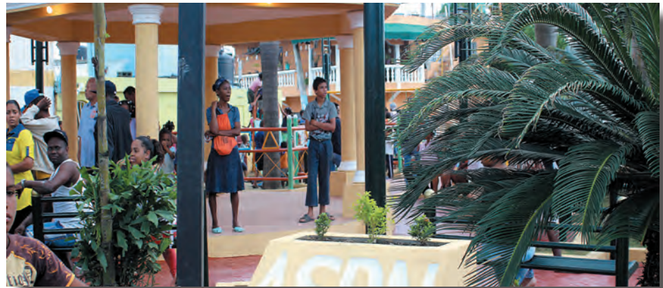
de los Cién Días de Gestión Municipal 2016-2020