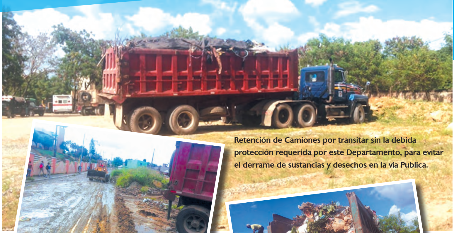
Retención de Camiones por transitar sin la debida protección requerida por este Departamento, para evitar el derrame de sustancias y desechos en la vía Publica.