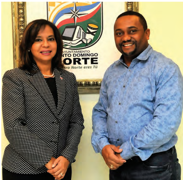
El alcalde de Santo Domingo Norte, René Polanco, recibe en su despacho la visita de cortesía de la directora de Pro-Consumidor, doctora Anina del Castillo. Los funcionarios aprovecharon el encuentro para evaluar la posibilidad de firmar un acuerdo interinstitucional, en el que el Ayuntamiento se comprometería a ubicar un local donde se puedan establecer oficinas de Pro-Consumidor en este municipio. El alcalde Polanco y la doctora del Castillo estimaron como de suma importancia el funcionamiento de las oficinas de Pro-Consumidor en el municipio Santo Domingo Norte, para defender y orientar a los ciudadanos en torno a los precios y la calidad de los productos que consumen.