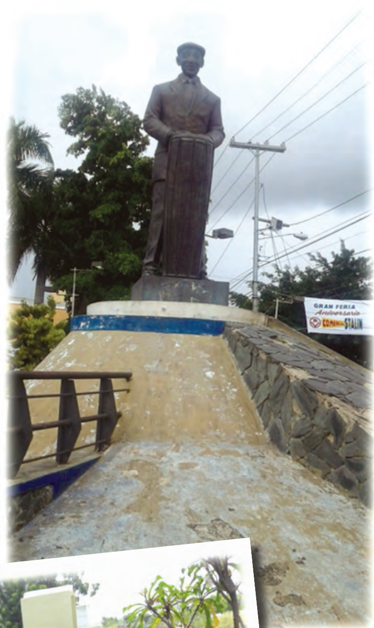
La Dirección de Espacios Públicos, realiza operativos de limpieza en el parque de Los Congos y Cruce de Sabán Perdida.