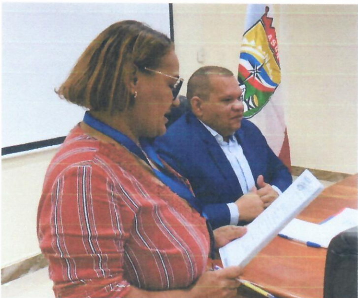
Foto Con Los Nuevos Integrantes De La Comisión De Seguimiento